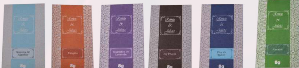
Nuvens de algodão Tângelo Segredos de lavanda Fig fleurs Flor de tahiti Alecrim