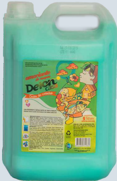
Onda de Carinho