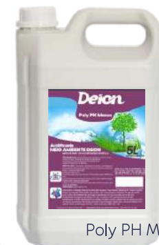
Poly PH Menos