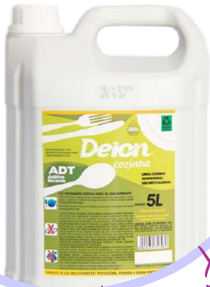
ADT Aditivo Secante