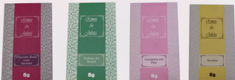
Pimenta rosa com amor Folhas do Brasil Cerejeira em flor Amable