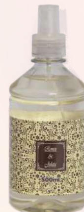
Cravo e canela