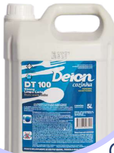
DT 100 Limpa Coifa