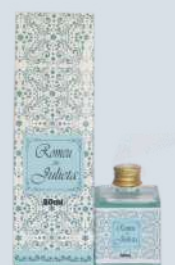
Nuvens de algodão