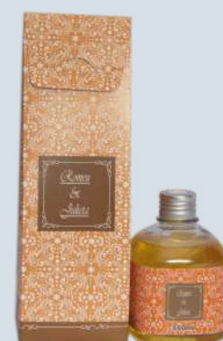
Maracujá com manga