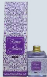
Segredos de Lavanda