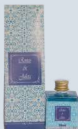
Flor de Tahiti