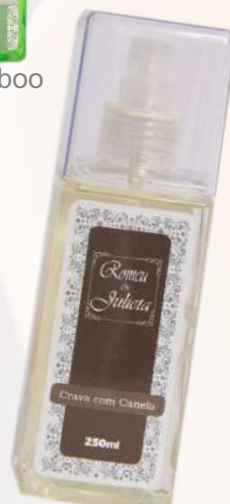
Cravo e canela