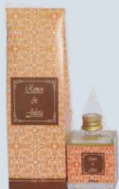
Maracujá com manga