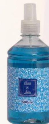
Flor de Tahiti