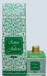
Folhas do Brasil