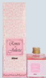
Cerejeira em flor