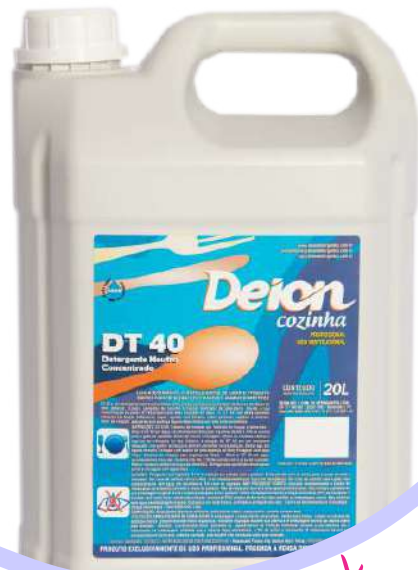
DT 40 Detergente Neutro Concentrado