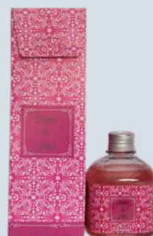
Pimenta rosa com ameixa