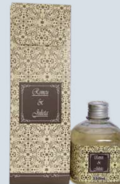
Cravo e canela