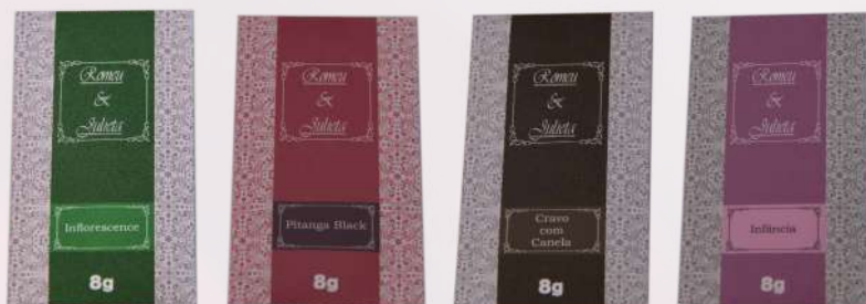
Inflorescence Pitanga black Cravo e canela Infância