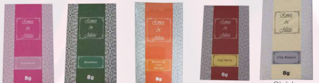
Intuizone Bamboo Maracujá com manga Goji berry Chá branco