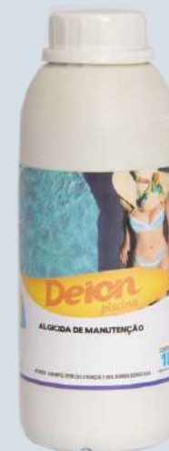
Algicida de manutenção