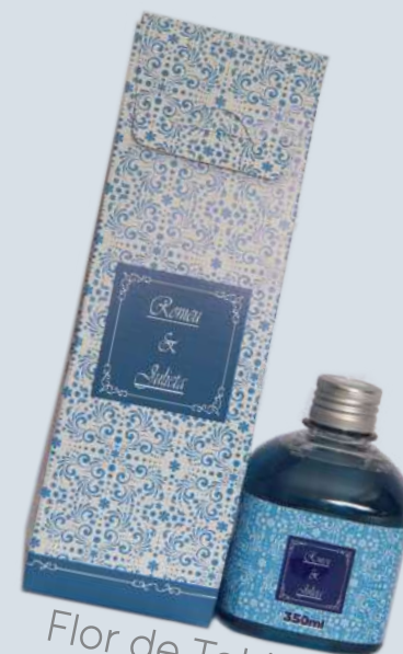
Flor de Tahiti