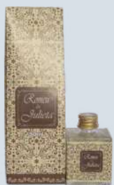
Cravo e canela