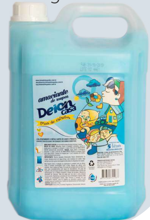
Nuvens de Algodão