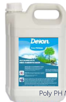
Poly PH Mais