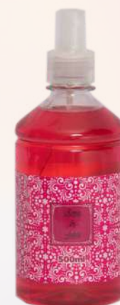
Pimenta rosa com ameixa