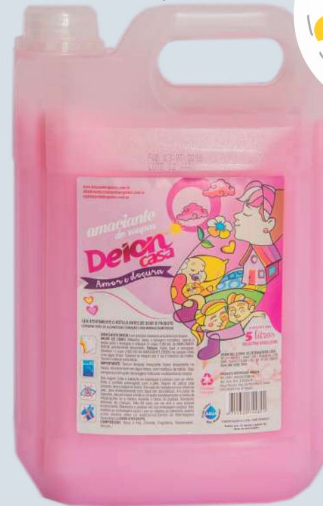
Amor e Doçura