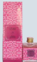
Pimenta rosa com ameixa